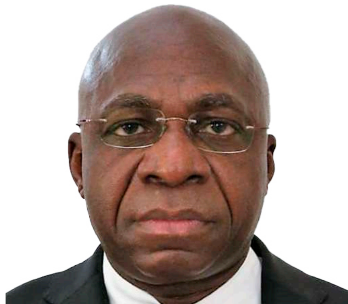
S.E. TÊTE ANTÓNIO Ministro das Relações Exteriores