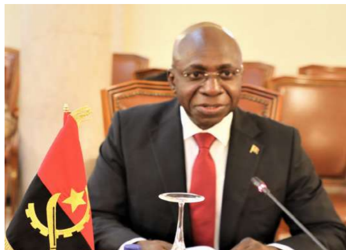
S.E. Tété António Ministro das Relações Exteriores da República de Angola