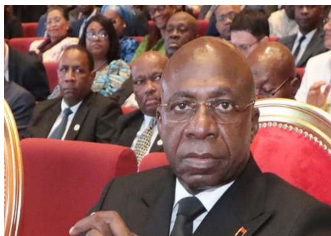
S.E Tété António Ministro das Relações Exteriores da República de Angola