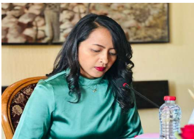
S.E. Rasata Rafavavitafika Ministra dos Negócios Estrangeiros da República de Madagáscar