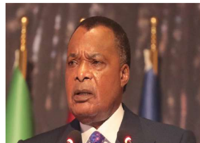
S.E Dennis Sassou Nguesso Presidente da República do Congo