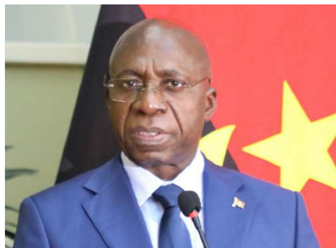
S.E. Tété António Ministro das Relações Exteriores da República de Angola