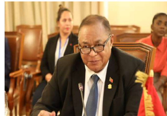
S.E. Bedito dos Santos Freitas Ministro dos Negócios Estrangeiros e Cooperação da República Democrática de Timor-Leste

Conhecendo a importância que as Embaixadas desempenham na aproximação dos Estados , na criação de mecanismos de cooperação , bem como na promoção e disseminação das potencialidades económicas e culturais dos países , o Ministro Tété António reconhece que, com este passo, as relações entre os dois países tendem a progredir para níveis maiores.