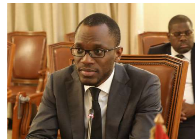
S.E. Olushegun Adjadi Bakari Ministro dos Negócios Estrangeiros da República do Benin